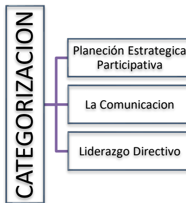
Figura 2 Categorización